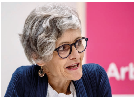
Therese Dietiker, Grossrätin

Auch nach der Sommerpause schien der bürgerliche Block weiterhin von früheren Vorstössen zu zehren und man stritt sich erneut über erst kürzlich abgelehnte Anliegen: So wurde der Schaffung von Förderklassen für Kinder mit besonderen heilpädagogischen Förderbedarf grundsätzlich ausserhalb der Regelklasse mit bürgerlicher Geschlossenheit zugestimmt.